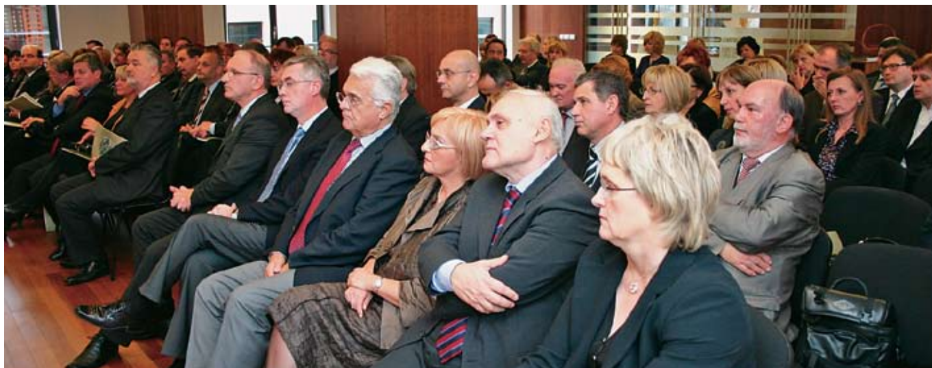
Dobitnici plakete i zahvalnice HJK za izuzetan doprinos javnobilježničkoj službi .