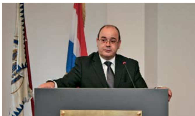
Mr.sc. Antun Palarić, sudac Ustavnog suda RH