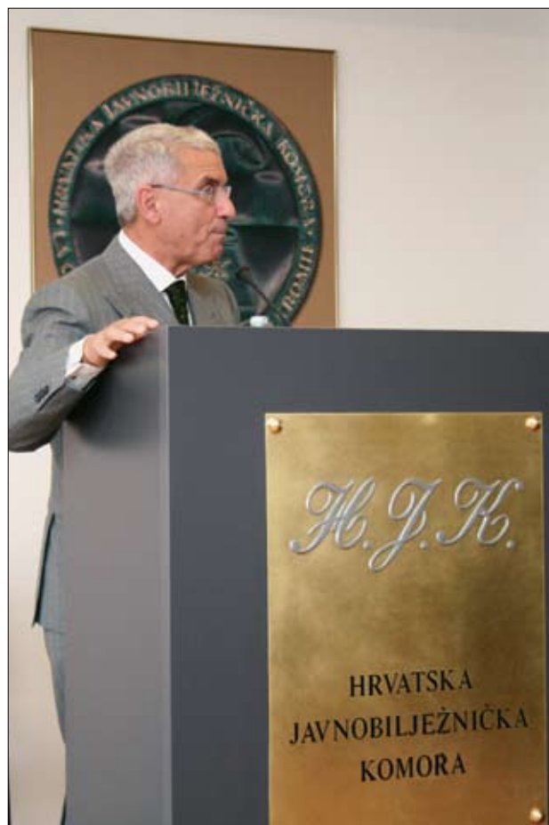
Roberto Barone, predsjednik Savjeta notarijata Europske unije

Unutar svojih okvira CNUE ima i obvezu sudjelovanja u uređivanju europskih normi i uključivanja bilježničkih komora na našem kontinentu u jednu tešku operaciju recipročne integracije, kako bi ponudili institucijama EU-a potporu u pravosudnoj izobrazbi i stručnoj praksi. Zato imamo radne skupine i radna povjerenstva koja se bave glavnim temama u raspravi koje nas zanimaju u svakodnevnom poslu: pravo nasljeđivanja, obiteljsko pravo, pravo trgovačkih društva, ove