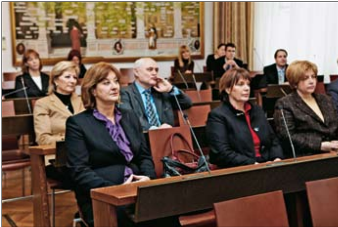
Predstavljanju su prisustvovali profesori s Pravnog fakulteta, suci i javni bilježnici