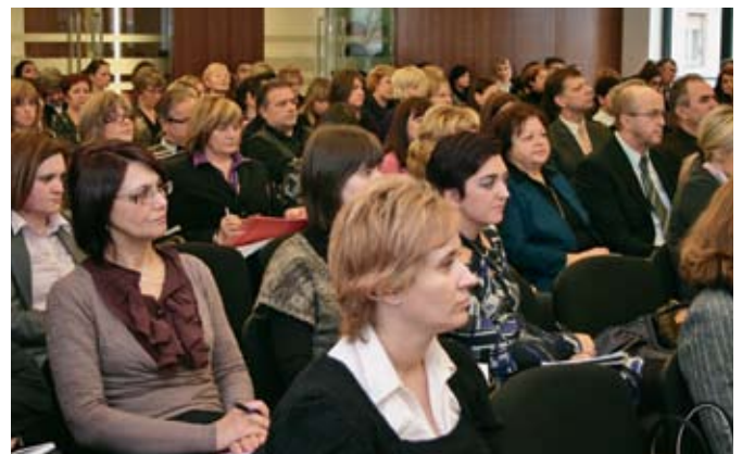
Sudionici i gosti Savjetovanja o Zakonu o poljoprivrednom zemljištu i Zakona o potrošačkom kreditiranju