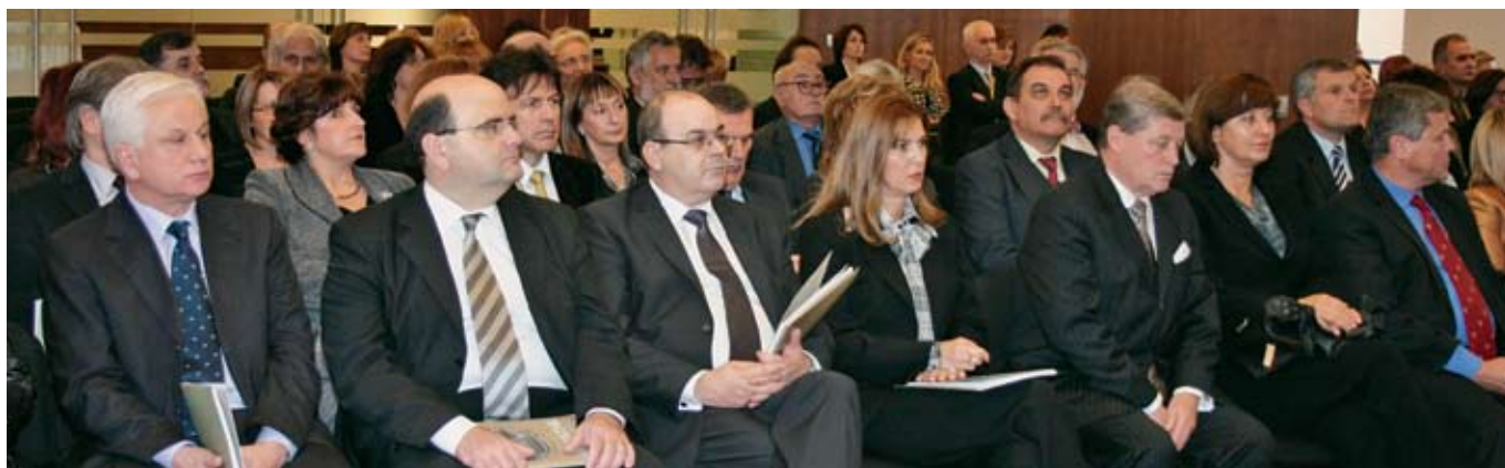
Brojni ugledni gosti svojim prisustvom odali su priznanje radu i djelovanju javnih bilježnika u Republici Hrvatskoj.