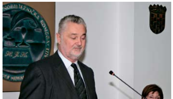
Boris Koketi, zamjenik glavnog državnog odvjetnika