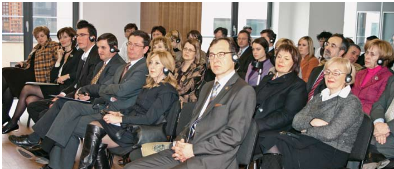
Prisutni su s mnogo pozornosti pratili izlaganje talijanskih kolega o prometu nekretnina i razrezu poreza na taj promet.