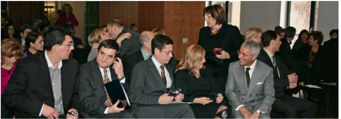
Ugledni gosti aktivno su sudjelovali na kolokviju o "Kompetencije notarijata u prometu nekretnina i razrezu poreza na promet nekretnina u Europskoj uniji".