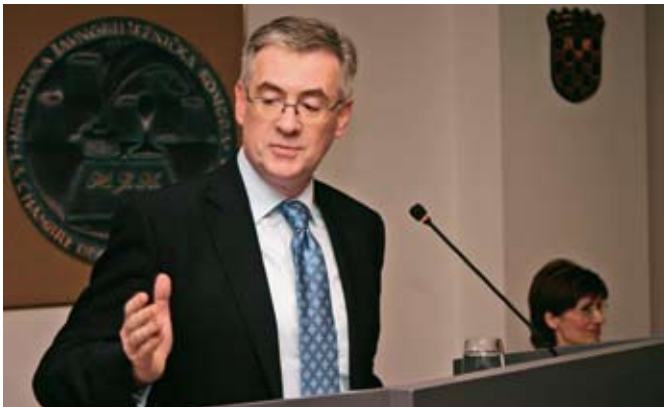
Branko Hrvatinić, predsjednik Vrhovnog suda RH