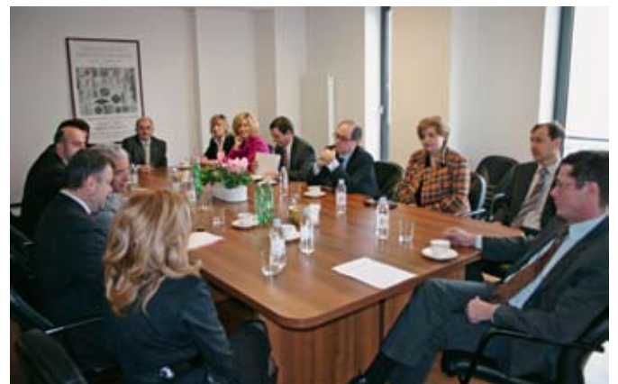
Razgovor s predstavnicima CNUE