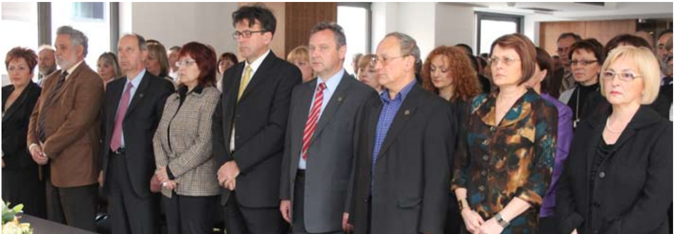
Početak rada Skupštine - intoniranje himne Republike Hrvatske