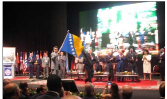
Na Glavnoj Skupštini primljeni su u članstvo Unije, notarijat Bosne i Hercegovine.