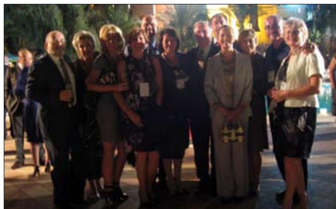
Hrvatska delegacija u Maroku

Konačni zaključci za obje znanstvene teme objavljeni su na web stranici Unije www.uinl.org