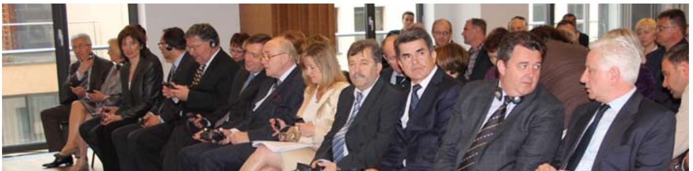
Svečanosti su prisustvovali brojni ugledni gosti iz susjednih zemalja i Hrvatske